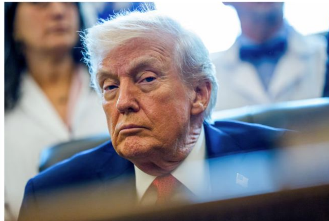
📷 Trump in the Oval Office in December.

President says morality 'the only thing that can stop me' in New York Times interview on limits to his authority