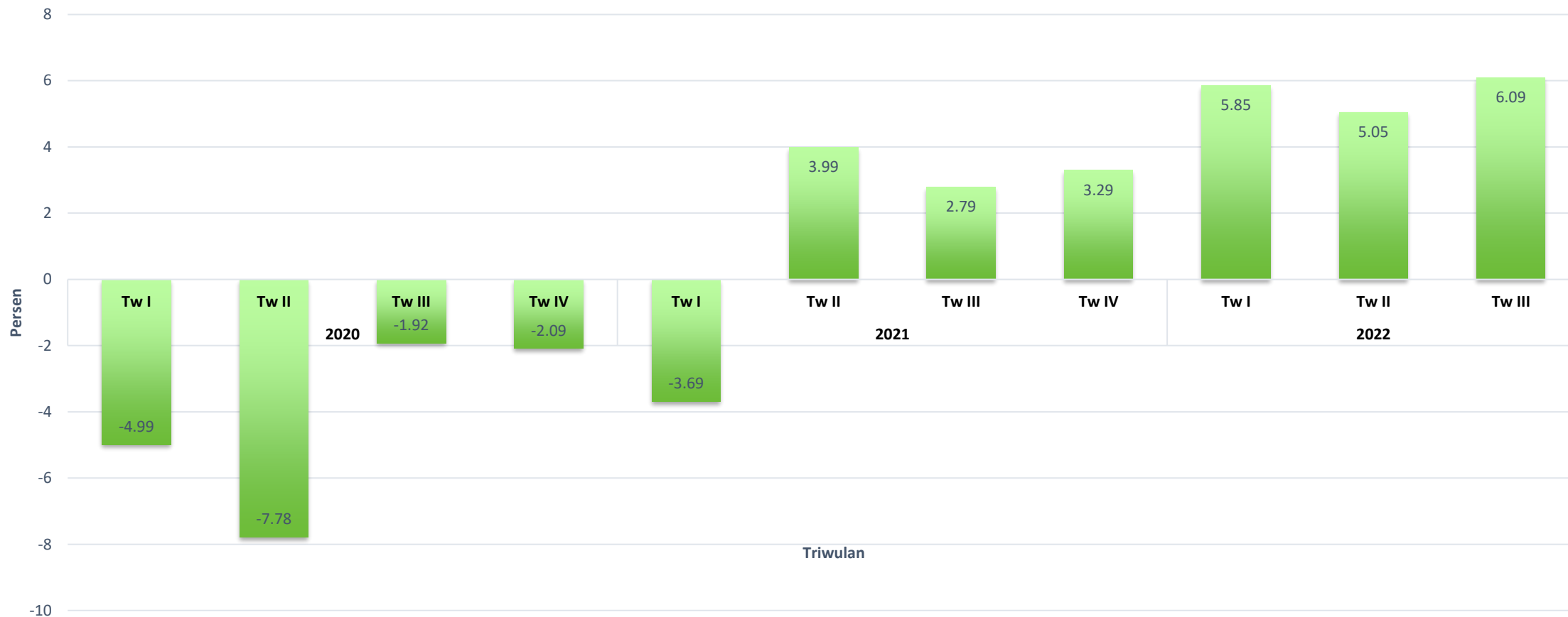
Pengeluaran Konsumsi LNPRT Per Triwulan 2020-2022