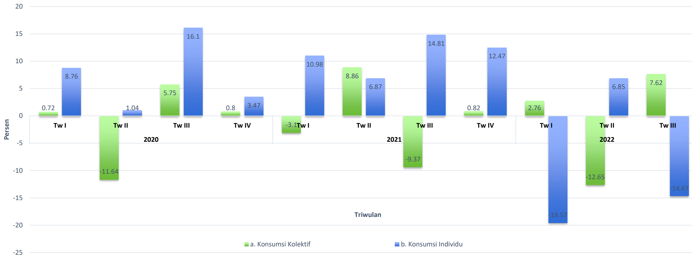
Pengeluaran Konsumsi Pemerintah Per Triwulan 2020-2022