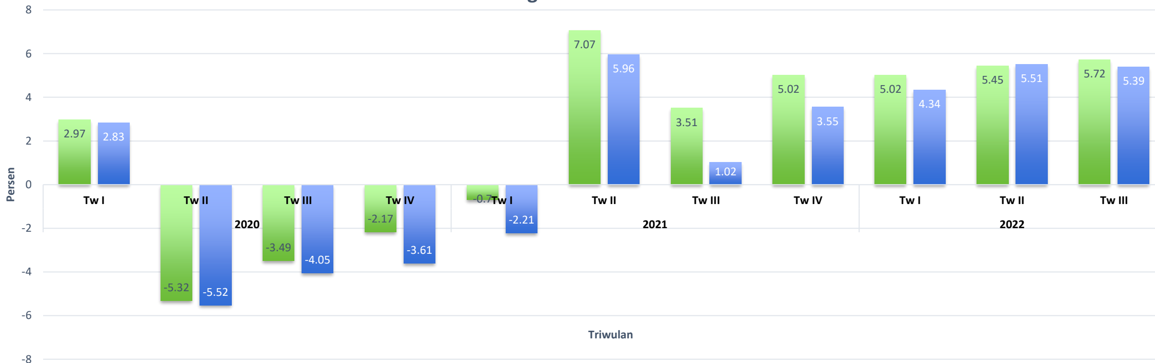
Pertumbuhan Ekonomi dan Pengeluaran Konsumsi RT Per Triwulan 2020-2022